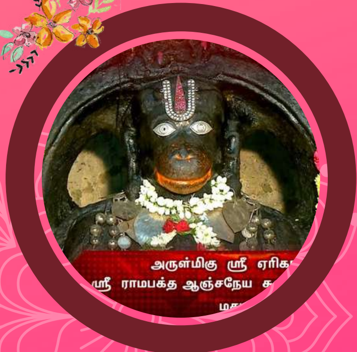
அருள்மிகு ஸ்ரீ ஏரிக ஸ்ரீ ராமபக்த ஆஞ்சநேய ச மது